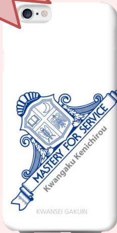
② 関西学院 エンブレム盾 (白)