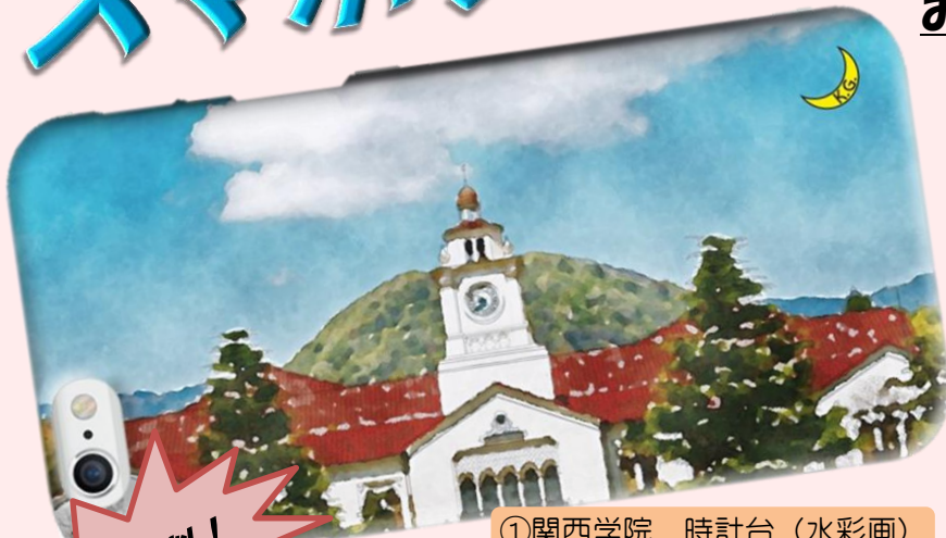
① 関西学院 時計台 (水彩画)