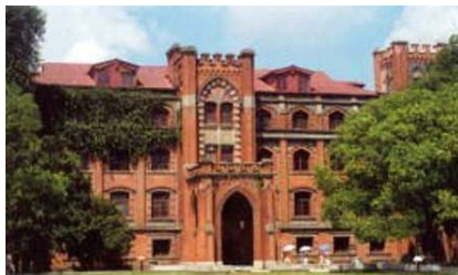
蘇州大学医学部(前身は、博習医院)