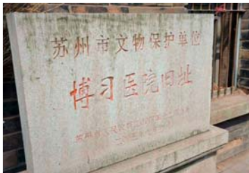
博習医院旧址(蘇州市)

旅行参加者の募集に合わせて、「旅行企画説明会」を大阪、東京で各1回開催いたしますので、お問い合わせの上、ご参加をお待ちしております。