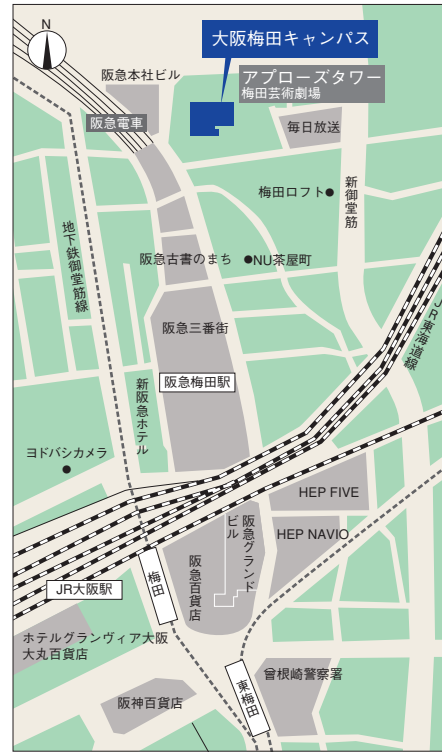
関西学院大学 大阪梅田キャンパス 阪急梅田駅茶屋町口下車北へ徒歩5分 大阪市北区茶屋町19-19 アプローチタワー10階・14階 TEL.06-6485-5611 http://www.kwansei.ac.jp/kg_hub/access/