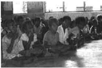
初めての歯ブラシをもって……

小生はそのポルトヴィラから小型機で1時間程北に飛んだ、マラクラ島という島で、約15年前から年に1〜2回、歯科医療活動をしております。最近では諸外国からいわゆる「文明」と称してチヨコレート等が、ライフラインの整っていない村々にまで入り込み、虫歯や歯周病が著しく増加してきました。その為、今まで行ってきた歯科治療や口腔内検診以外に、具体的な歯ブラシ指導や、病院関係者への啓発活動も始めております。いずれも細々とした活動ですが、決して豊かではないけれども非常に穏やかなバヌアツの人々に助けられてここまで続けることが出来たと思っております。又、中学部や啓明学院の生徒の皆さんには歯ブラシ収集で協力して頂くなど、中学部、高等部とお世話になりながら、大学は裏切ってますか？ 歯学部へ進んだ小生を、暖かく迎えてくれる関西学院に感謝しております。