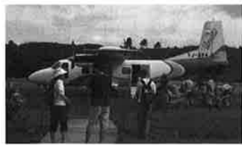
飛行場 (といっても単なる原っぱです。)

1980年に独立するまでは、英仏両国の統治下にありました。年配の方々には、ニューヘブリデス諸島という方が解り易いかもしれません。温厚なバヌアツ人をして「貧しくても独立したい」と思わせる程、統治下時代は大変な苦悩もあったようです。しかし2006年には、シンクタンク「新経済財団」等から「地球上で最も幸せな国」に選ばれています。