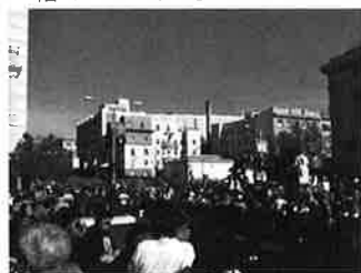
SF ジャイアンツ優勝パレード

サンフランシスコ、シリコンバレー地区では相変わらず失業率が高く、持てる者と持たざる者の格差が広がっているような感があります。