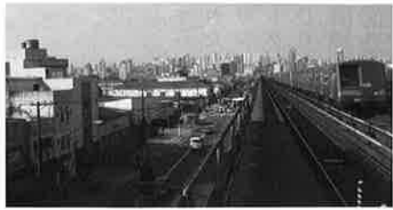
地下から外へ出た地下鉄車両

している。市民の多くは数年先のW杯まで2016年のリオ夏季オリンピックなど今は話題にもしませんが、しかし、いざその時になると何とか格好をつけるのがブラジルのでしょうか。