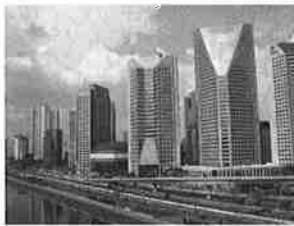
ブルックリン ノーボ地区

51年前に出来た関西学院同窓会ブラジル支部はサンパウロにあり、現在総会員数21名で、関西学院同窓会公認の中南米研究会OB・OGの「かりぶと会」と交流も深めています。また近い将来、昨年6月に提携・協定